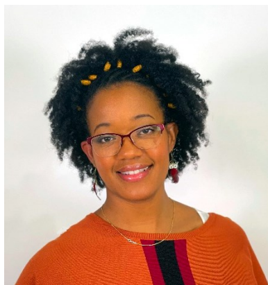
Baja la fotografía Jpeg