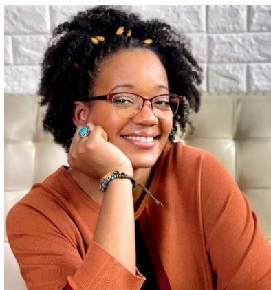
Baja la fotografía Jpeg