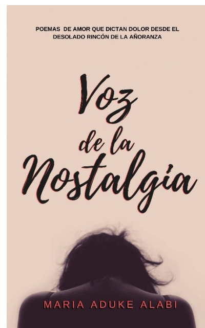
Baja la fotografía Jpeg