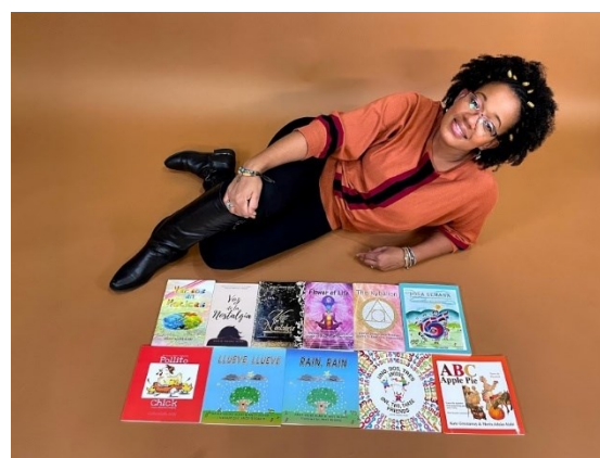
Baja la fotografía Jpeg